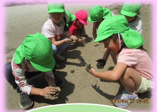
どろだんご作り 「ぴかぴかしてきたよ」