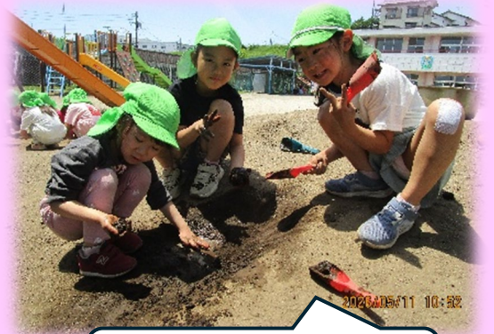
よし!泥団子つくるぞ!