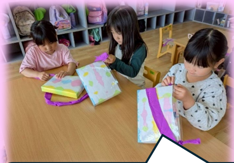
お散歩バック作り 自分で紐通して縛って完成!