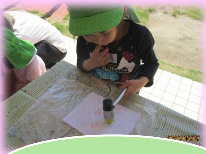
たたき染めに挑戦!