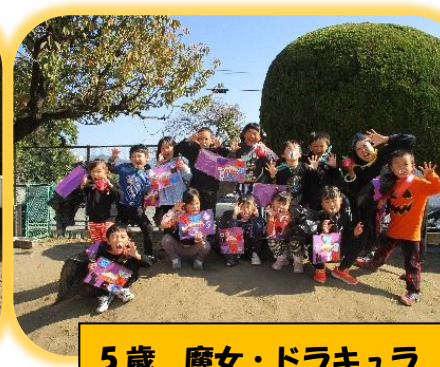
5歳 魔女・ドラキュラ