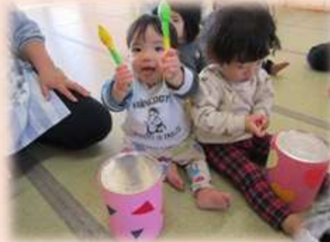
おおきなたいこドンドン♪ みてみて~