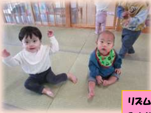
リズムのうたに合わせて♪ みんな/1/1♪