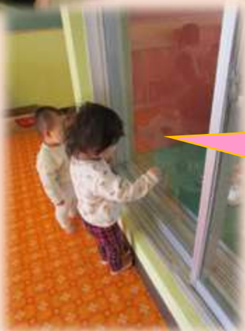
「いいにおいがするな~」 と、においに誘われ給食室を のぞく二人です…可愛い♡