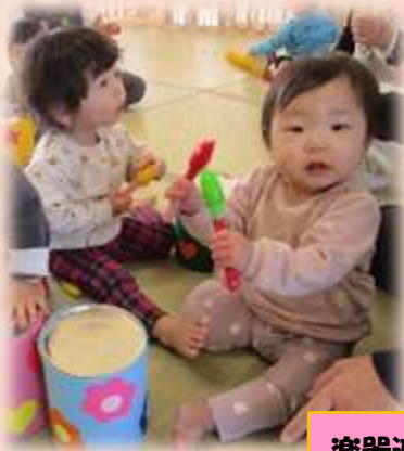
楽器遊び♪ トントン叩くの楽しいよ!!