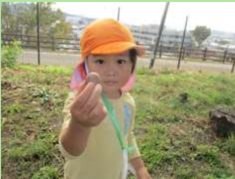
大間々高枝まで散歩に行って、クヌギをたくさん拾ってきました！