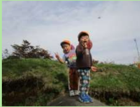
東新川公園にゆい組と 行ってきました。 たくさん遊んで楽しか った！！