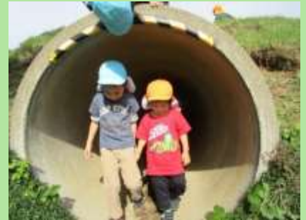
トンネルの中は暗かった～ゆい組 さんに助けってもらったよ