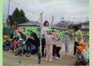
リレー 大間々保育園見事1位👑