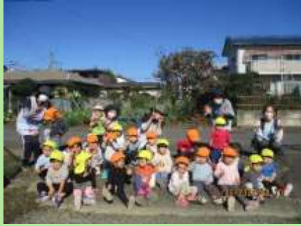
あんず組のお友だちと一緒に 電車を見に行ってきたよ！