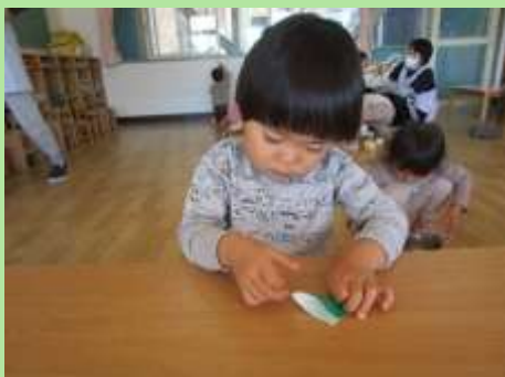
折り紙の三角 折に挑戦！ 指先を使って、 丁寧に…