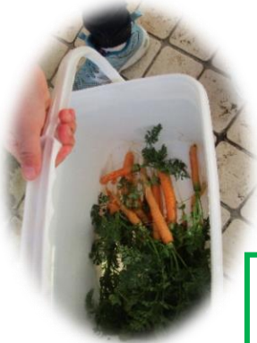
人参収穫！！ 美味し～い😊