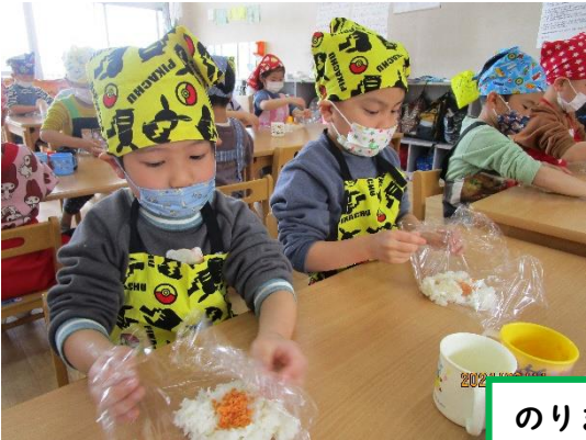
のりまきおにぎり作り！！ 美味しかったです♥