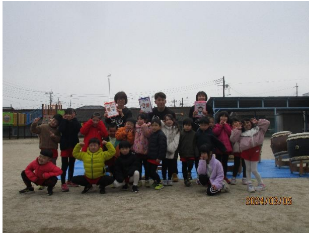
たぶちさん つるちゃん れいこさん ありがとうございました！ みんなで、絵を描いてプレゼントしました！！