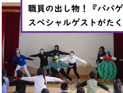
職員の出し物！『パパゲーノとパパゲーナ』 スペシャルゲストがたくさん登場😊