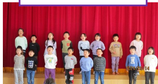
最後に年長さんの歌「つばめ」 感動しました😭