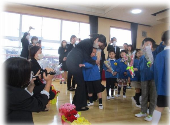
ご卒園おめでとうございます！ 16名のお友だちが卒園しました。 小学校はばらばらになってしまう けど、頑張ってください！！