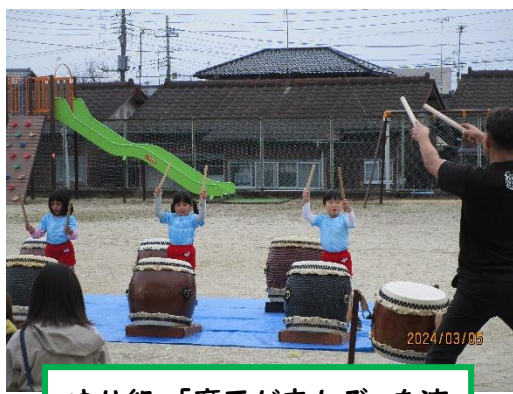
ゆり組・「魔王が来たぞ」を演奏！ 和太鼓、楽しかった😊