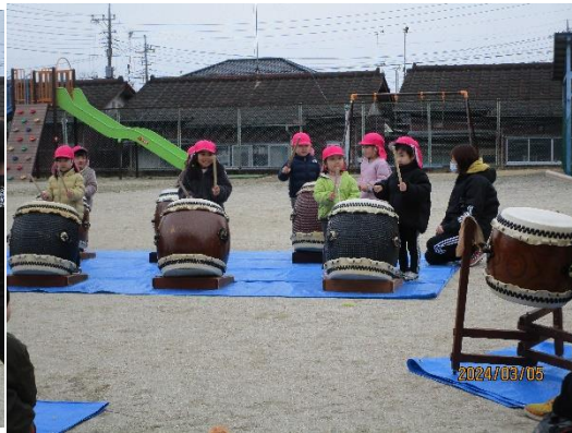
小さいクラスのお友だちも楽しく叩きました！！