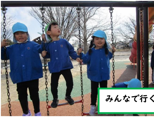
みんなで行く最後の園外保育！「交通公園」