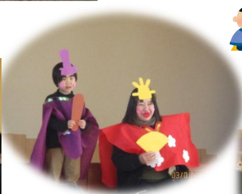
♪うれしいひなまつり♪ に合わせて、みんなで踊りました！ スペシャルゲストも登場！！