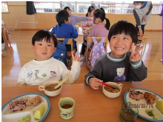
お別れ会の後、ホール でスペシャルメニ ューを頂きました