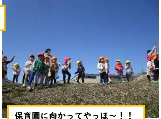
保育園に向かってやっほ～！！