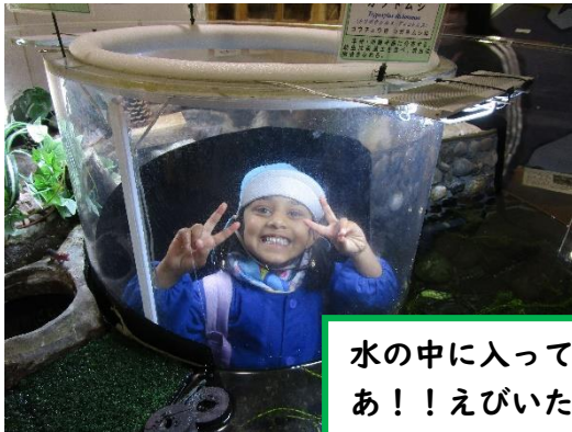
水の中に入ってるみたい あ！！えびいたよ