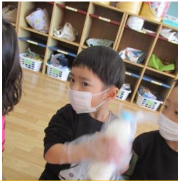
バター作り もう固まったかな??