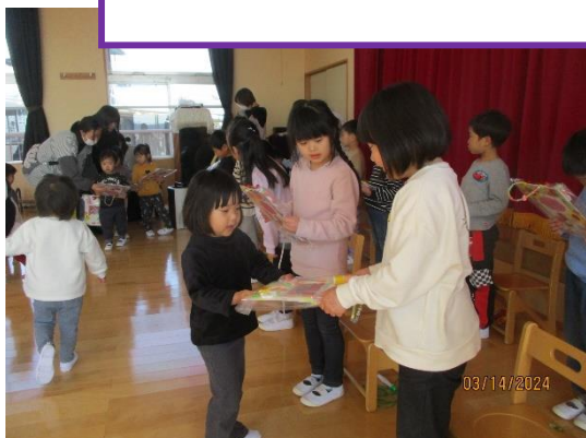
小さいクラスのお友だちからステキなプレゼントをもらいました