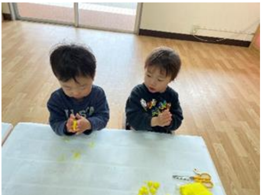
紙粘土 コロコロ丸めたのしかったね。