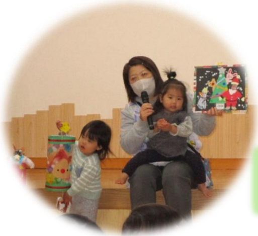
みんな素敵な 作品ができました😊