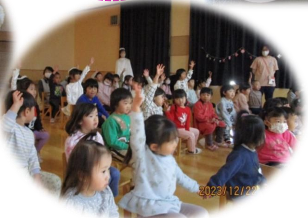
サンタさんへ聞いてみたよ☆ サンタさんはこの服しか持ってなかったのか！ ホ～ッホッホッホって挨拶なんだって～ 色々知れたね(^_^)