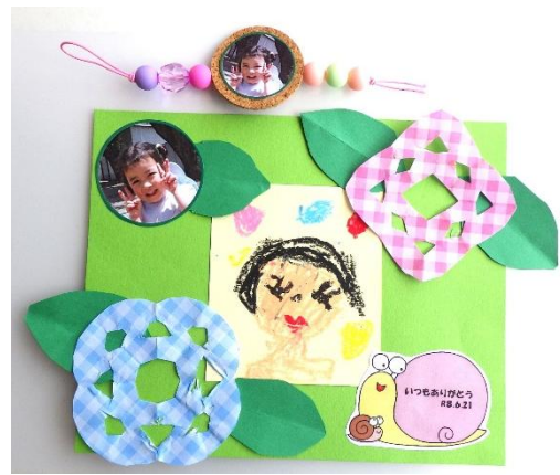
メッセージカード/ぞう組(4歳児) パパの似顔絵を描いて、切り紙をしたよ。 ビーズを通して袋留めの飾りも作ったよ。