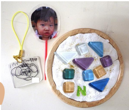
コースター・ストラップ/うさぎ組(3歳児) フラ板で作ったストラップと、石粉粘土にタイルを埋め込んでコースターを作ったよ。パパのイニシャルも入れたよ♡