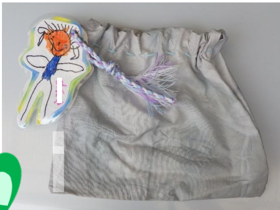
巾着袋/らいおん組(5歳児) 輪ゴムで縛って、紫キャベツの葉で染めたよ。ママとお揃いだよ♪