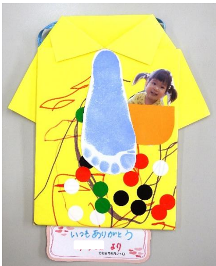
Yシャツのタペストリー/ぱんだ組(1歳児) お絵描きをした紙をシャツに折って、丸シールを貼ったよ。ネクタイは足型。ポケットからは可愛い顔がひょっこり♡