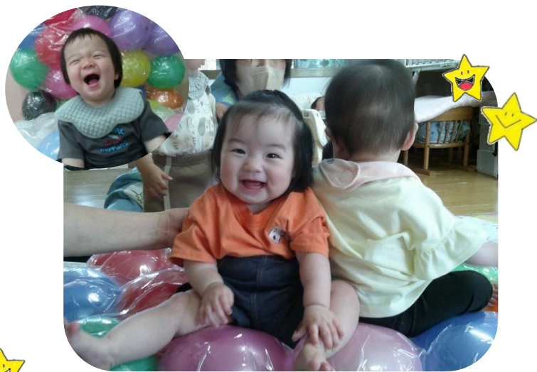
風船ベッドで遊んだよ♪ひよこ組(0歳児)

先月から始まったプール遊び。冷たい水の感触が、気持ち良い季節になりました。子ども達はプールをずっと楽しみにしているようで、晴れた日には園庭から楽しそうな歓声が響き渡っています。季節ならではの遊びを心と身体いっばいに感じながら、楽しめる時間になればと考えています。