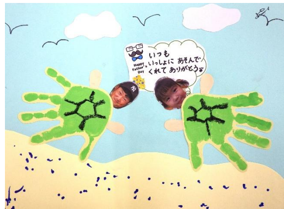
メッセージカード/りす組(2歳児) 手形をカメの甲羅にしたよ。大好きなパパと一緒に♡