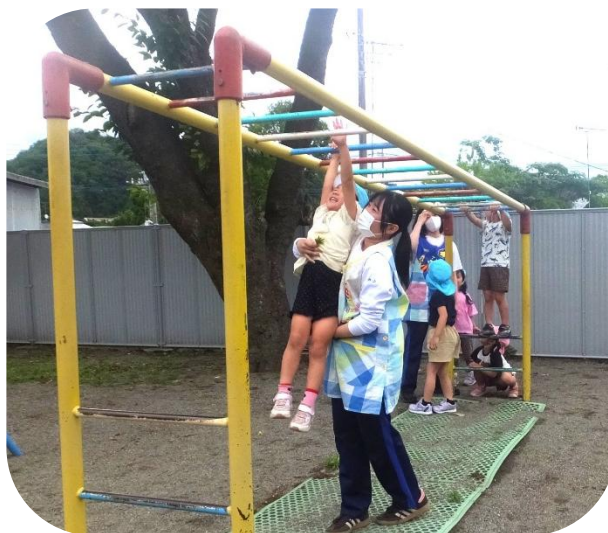
お姉さんがうんていを手伝ってくれたよ。