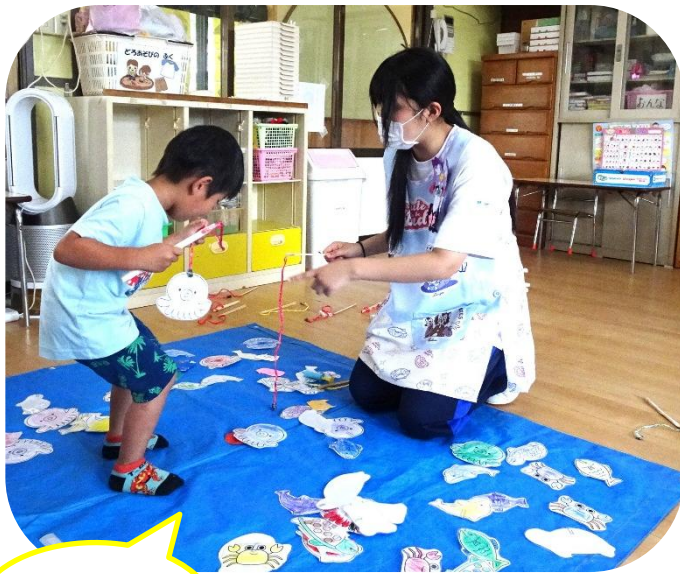
釣れるかな？ お魚釣り遊びをしたよ。