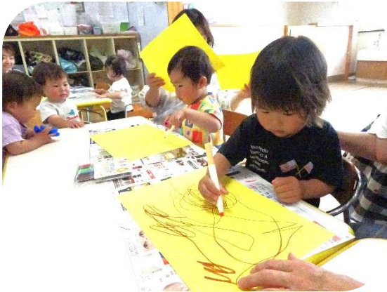
お絵描きも大好き!