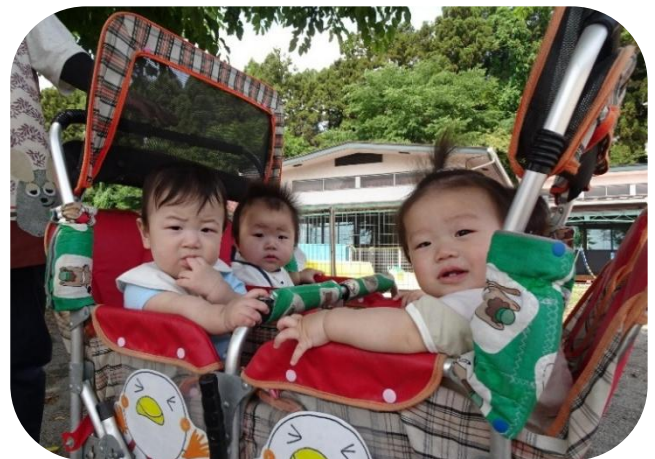
ベビーカーで外気浴。気持ちいいね