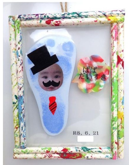
壁掛け/ひよこ組(0歳児) ケースにストローと絵の具を入れて振ったら素敵な柄のフレームが完成！足型にお顔を付けて大好きなパパに変身♡