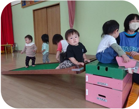
巧技台のほいで足腰腕の力をつけるよ!