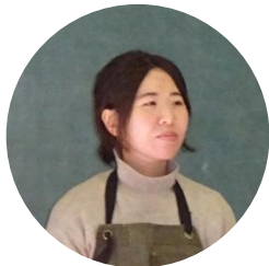
えい先生 (アロマの先生)