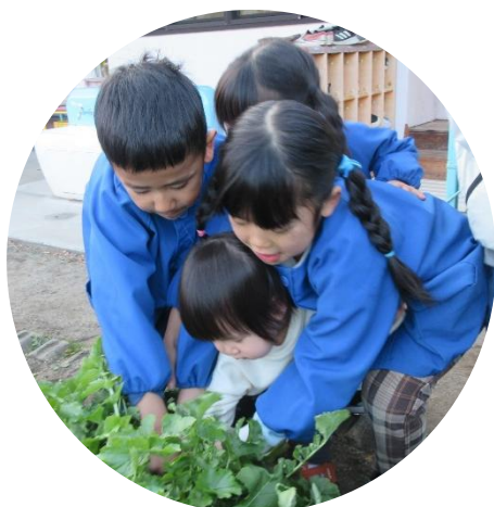
らいおん組のお兄さん・お姉さんと一緒に、 園庭の畑の大根を収穫したよ。