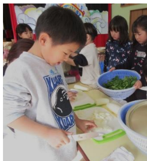
らいおん組は、包丁やピーラーを使って大根を調理したよ。