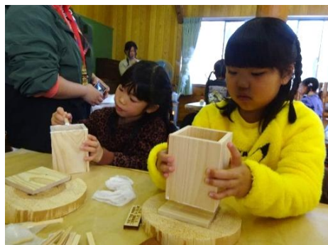
④ 底板にボンドをつける