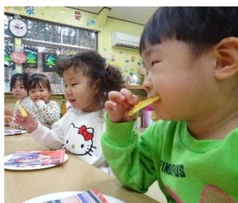
さつまいもをスライスして、 油で揚げ焼きしたよ。