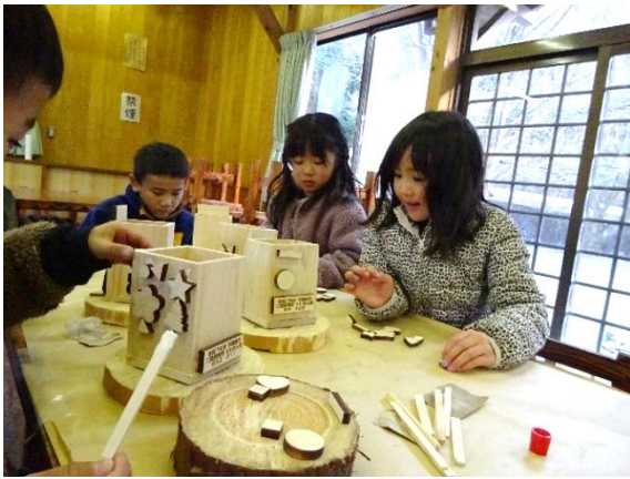
⑤ パーツをボンドで付ける