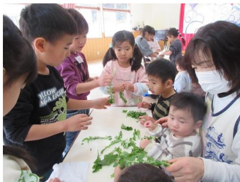
収穫した野菜の葉をちぎってみたよ！