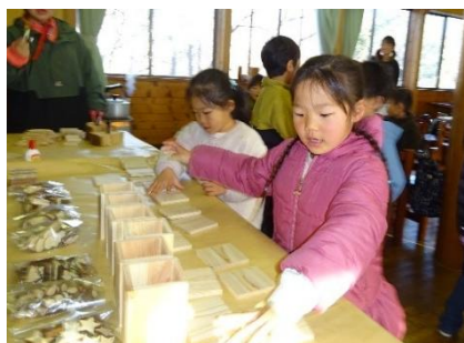
① 好きなパーツを選ぶ