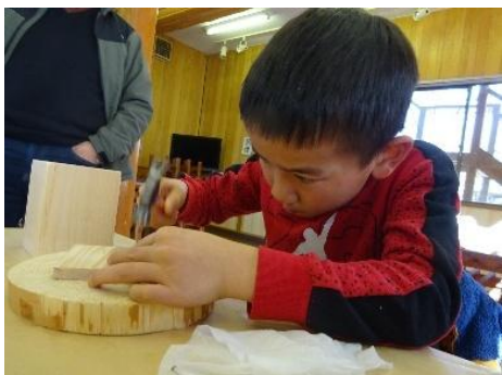
③ 金づちを使ってくぎ打ち