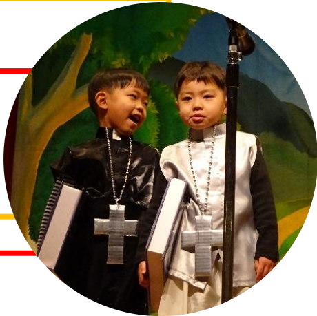
大きな声が聞こえるね。