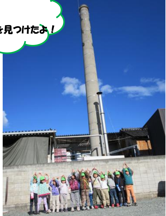
えんとつポーズ…笑