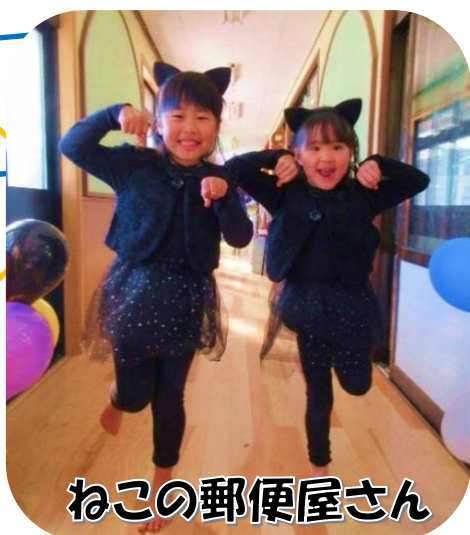
ねこの郵便屋さん