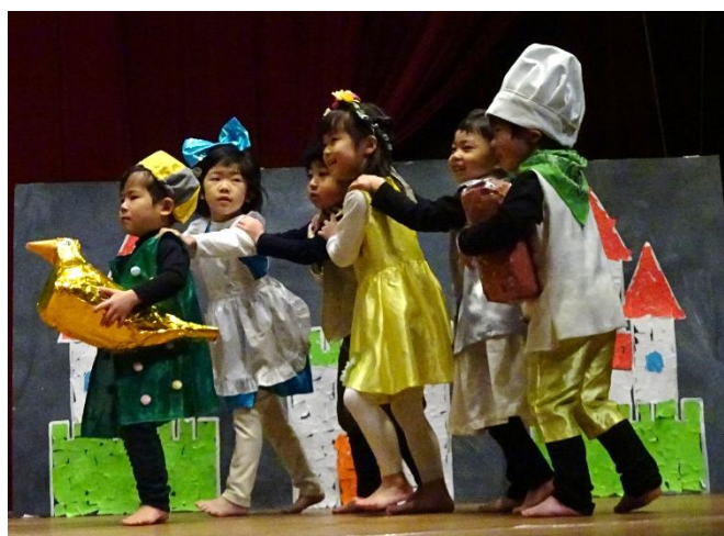
つぎつぎと 金のがちょうにくっついてしまい…