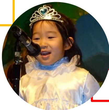
おー ほほほ。 なんておもしろい行列なの。