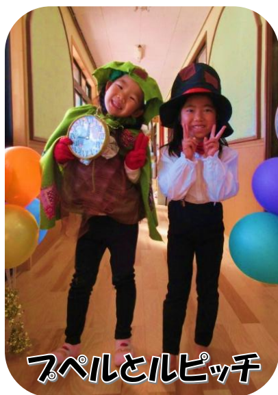
フペルとルピッチ