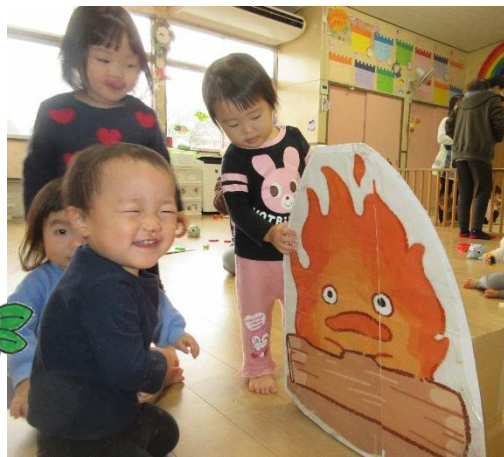
たき火ごっこで「あったか〜い」 (ぱんだ組/1歳児)