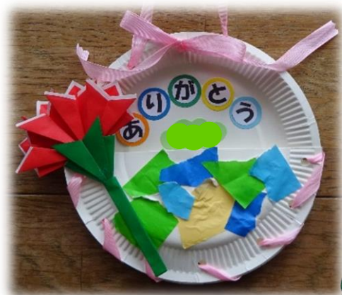
小物入れ/いす組(2歳児) 紙皿に折り紙をちぎって のりで貼り付けて柄にしたよ。