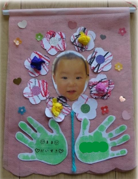
タペストリー/ぱんだ組(1歳児)・ひよこ組(0歳児) 写真の周りになぐり書きをした画用紙を お花の形にして手形を葉っぱにしたよ。