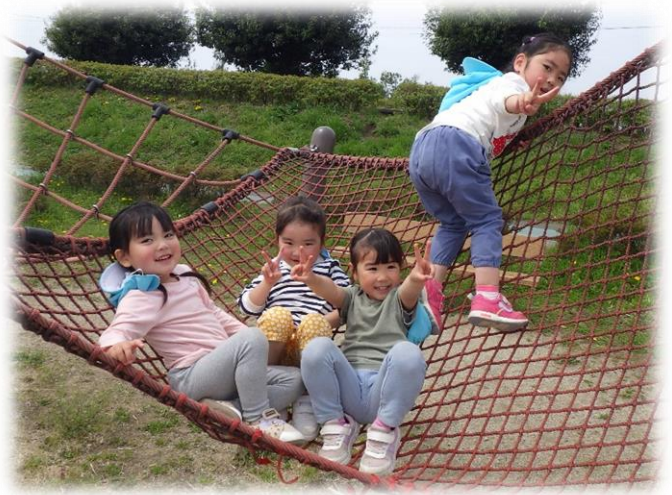
膳城址公園にて(うさぎ組/3歳児)