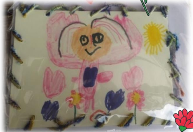
メッセージカード/ぞう組(4歳児) ママを描いて回りは毛糸で ひも通しをしたよ。