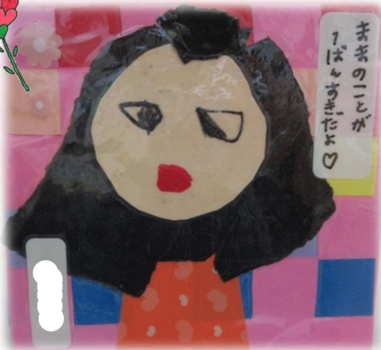
コースター/らいおん組(5歳児) 細長く切った色画用紙を 編み込んでコースターを 作りママの顔を貼ったよ。