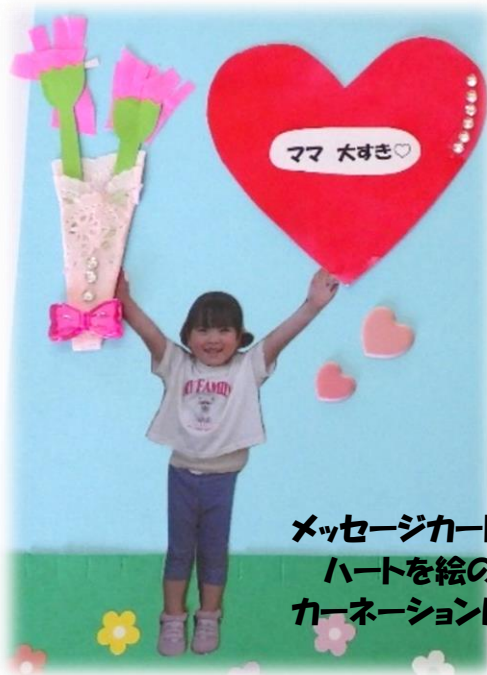
メッセージカード/うさぎ組(3歳児) ハートを絵の具で塗って カーネーションはハサミで切ったよ。