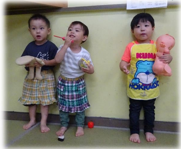
エフロン姿が似合うでしょ♥