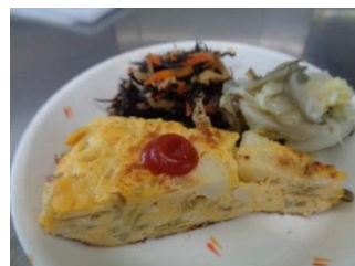
スパニッシュオムレツ