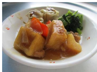
高野豆腐のオランダ煮