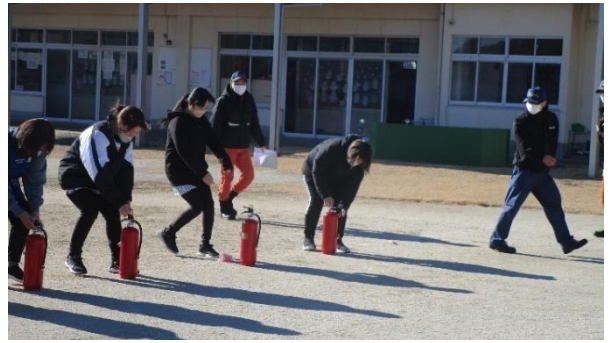
水消火器で消火訓練をしました。