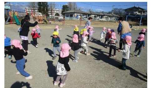
わあーっ にげろー!!