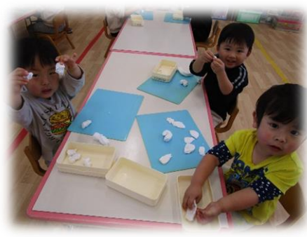
ちぎちぎ こねこね 粘土あそび♪