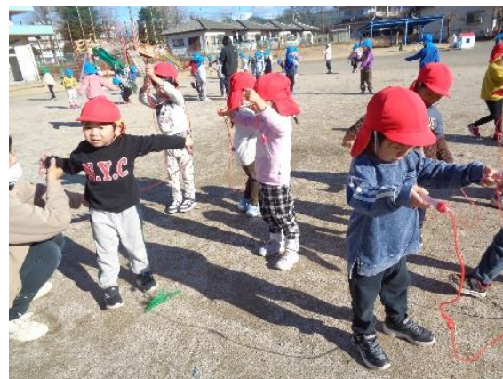
なわとび がんばるぞい