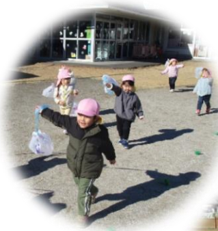
お絵かきした凧を 凧あげしたよ!