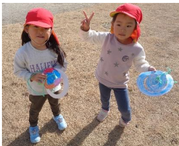
へびたこつくったよ♪