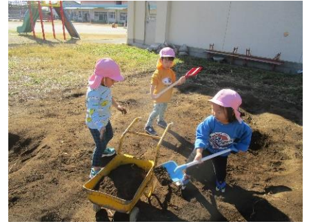
ぼくたち 建設会社です