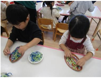
毛糸を貼り付けて...みのむしになりました