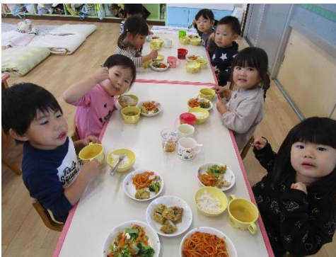
おいしい給食 いただきま〜す