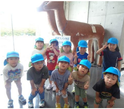
色々見られて面白かったよ!!