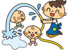
「水遊び気持ちがいいな」😊