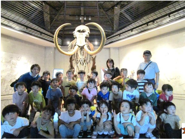
マンモス大きいな!!