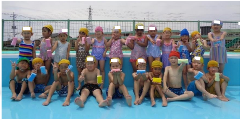
きれいになったプールで たくさん遊ぼう!!

プール開きでは、プールでの約束を確認したり、園長先生と子ども達の代表によるテープカットをしました。 プールや水遊びが楽しくたくさん出来ますようにと、みんなで水の神様にお願いしました。