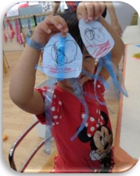
切ったり、塗ったり、描いたり 製作楽しいよ