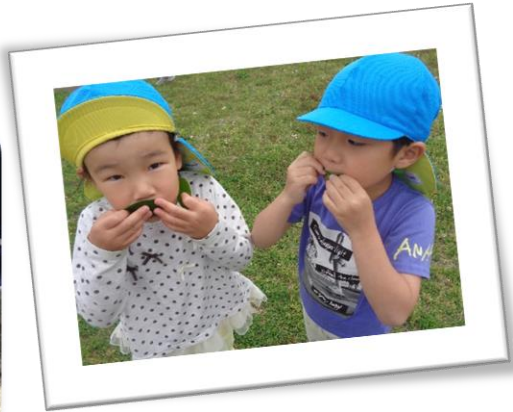
葉っぱ笛「ピーピー」 じょうずにふけるよ♪