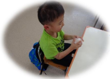
おにぎりつくれたよ🍙