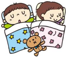
たくさん遊んだ後はゆっくりお休みなさい