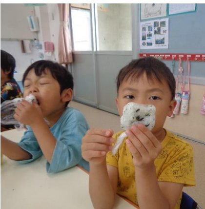
自分で作ったおにぎりおいしいな♪