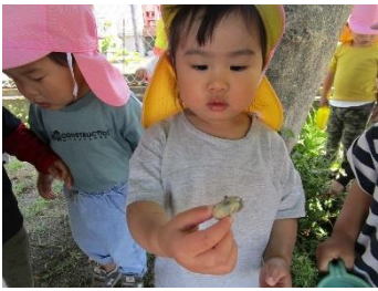
カブトムシの幼虫 みつけた