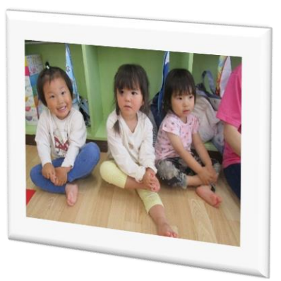
みんなでリズムたのしいね🎵