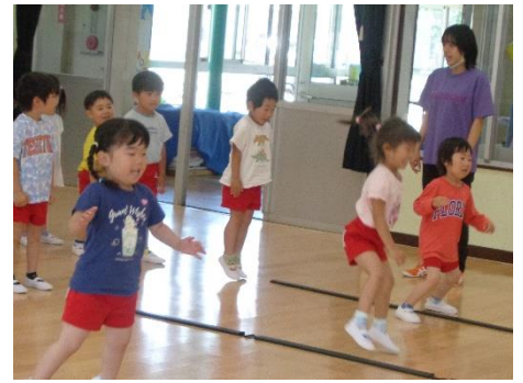
リズムジャンプたのしいな♡