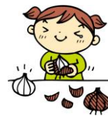
今日のタマネギは、 ナポリタンに入るん だって♪