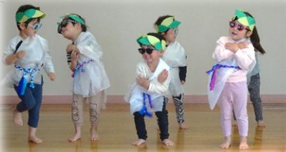
ひまわり組 つくしさんに