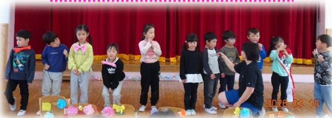
ひまわり組さんの司会

3月19日(木) 5歳児(つくし組)のお兄さん・お姉さんに「ありがとう」の気持ちを含めて4歳児(ひまわり組)が司会を務め、盛り上げてくれました。また各クラスの子ども達・職員で、歌や踊りなど出し物を披露し楽しい時間を過ごしました♪