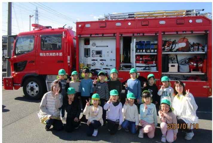
消防車と一緒に記念撮影