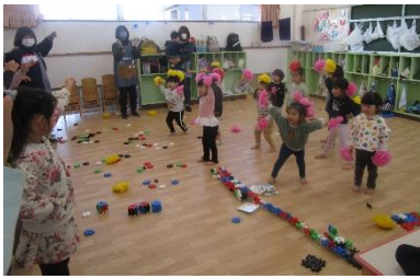
ゆりぐみのおゆうぎ楽しいな♪