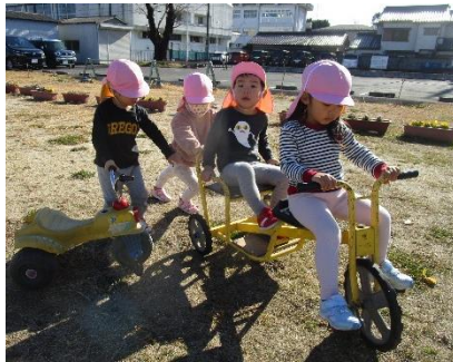
お友だちと一緒に♡