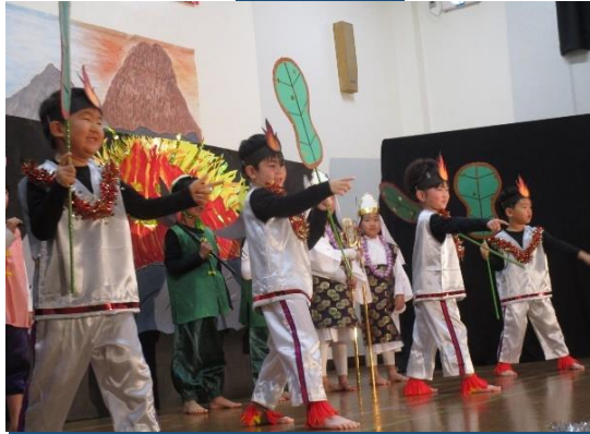
炎のようかい「バショオ」