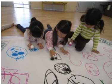
大きな紙で お絵かき楽しいね♪