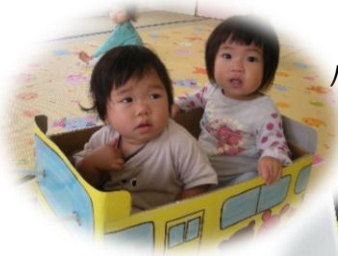
バスに乗って しゅぱーつ♥