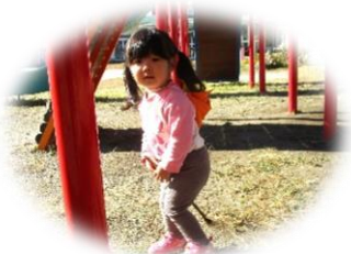
魔法使いにへんしーん!!