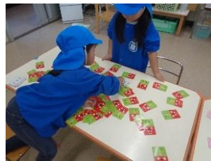
ルール覚えて楽しいな♪