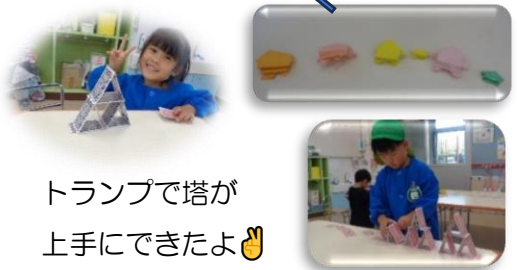
トランプで塔が上手にできたよ👊

毎日に朝晩の気温が低くなり、登園してくる子ども達の手がひんやりと感じられることが多くなりました。日中は日差しが出ると暖かいです、かなり寒いときもあるので、体調管理に気をつけて過ごしていきたいと思ひます。