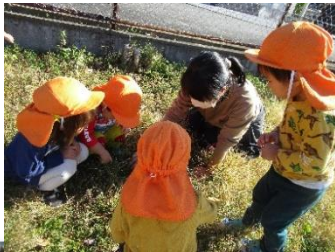
色々な 秋みーつけた🎵