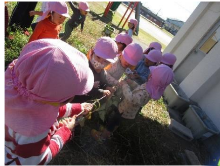
「うんしょ とこしょ」