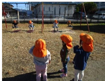
1. 2. 3・・・ じゅんばんこ