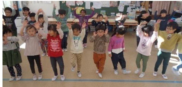
発表会練習楽しいよ😊