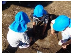
硬い泥団子を作るぞ👊