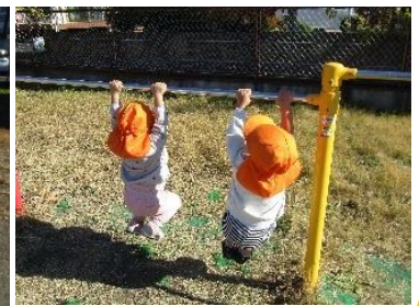
ぶーらん上手になったね