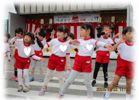
柏四園合同で WA になって踊ろうを 踊りました🎵