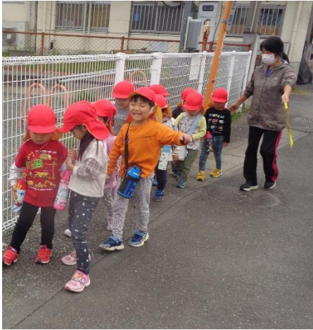
園周辺を 散歩しました👧