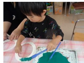
みんなで育てたオクラで スタンプ楽しいよ♪