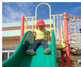
はみ出さないように ゆっくりと