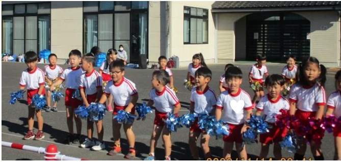
大間々保育園との合同遊戯 愛のしるしです♡ 「大間々・ひがし」の掛け声が決まりました!!