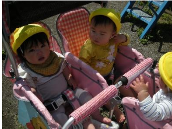
天気の良い日は 園庭をお散歩

ご入園おめでとうございます。ひよこ組0歳児は、今年度4名の新入園児さんでスタートしました。何でもはじめての0歳児の子ども達。園生活に不安を感じ泣いてしまう姿を見て保護者の皆様も心配が多いかと思いますが、一人ひとりのペースを大切にしながら信頼関係を築き子ども達の成長に寄り添って、過ごしていきたいと思ひます。園生活について不安な点などありましたらいつでも声を掛けてくださいね。どんどん成長をしていく時期でもあります、一つひとつの成長を共に喜び合えたらと思ひます。一年間どうぞよろしくお願ひいたします。