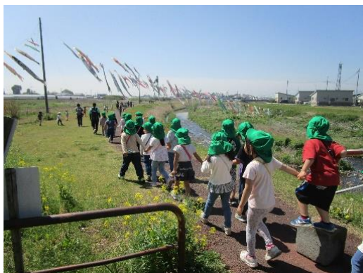
たくさんのこいのぼり 川边には菜の花