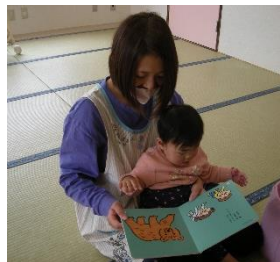
先生とゆったり スキンシップ