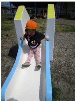
お外で遊ぶの 楽しいな