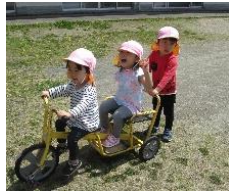
お友だちと遊ぶの楽しいね