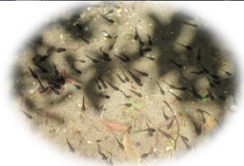
ゆり組になって初めての園外保育 たのしかったね!