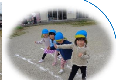
かけっこまけないぞ！