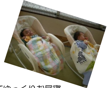
たくさん食べてゆっくりお昼寝