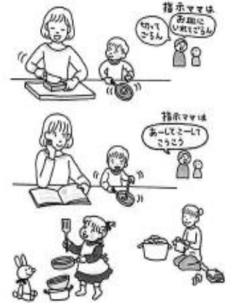
「想像力を育てよう」～子育て支援 ひだまり通園 高山静子著 チャイルド社より