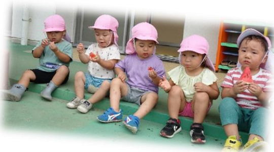
種を飛ばした後、 美味しく頂きました!!