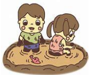
絵の具ペタペタ... 気持ちいいね!! 色が つくのが楽しいね♥