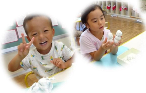
粘土で遊ぶって楽しいね♪